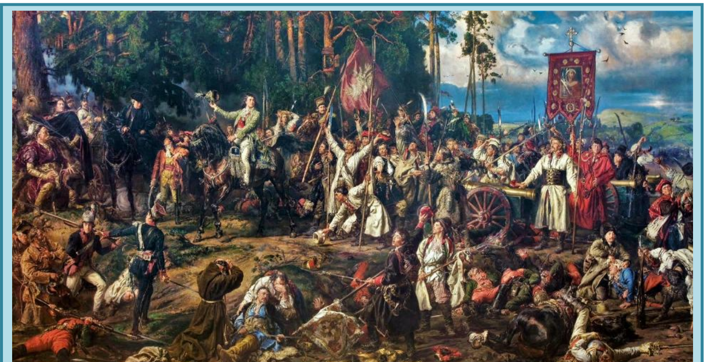
Kosynierzy - Kościuszko pod Raclawicami Jana Matejki.

Wygrana pod Raclawicami miała istotne znaczenie polityczne. Wiara w zwycięstwo pozwoliła wzniecić powstanie w innych rejonach kraju. Pokazała znaczenie udziału chłopów w powstaniu. Po bitwie, jak nakazywała ówczesna tradycja, dowódca przebrał się w mundur oddziału, który odniósł największy sukces w walce. Była to chłopska sukmana.