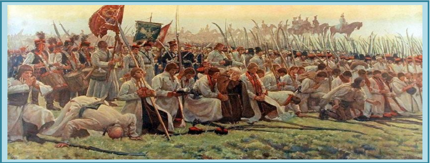
Kosynierzy modlący się przed bitwą na obrazie Józefa Chełmońskiego

Insurekcja objęła tereny Warszawy, okolice Krakowa, Poznania a także Litwę.