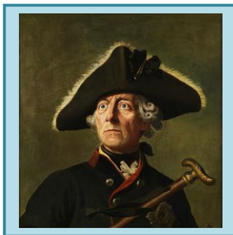
król pruski Fryderyk II