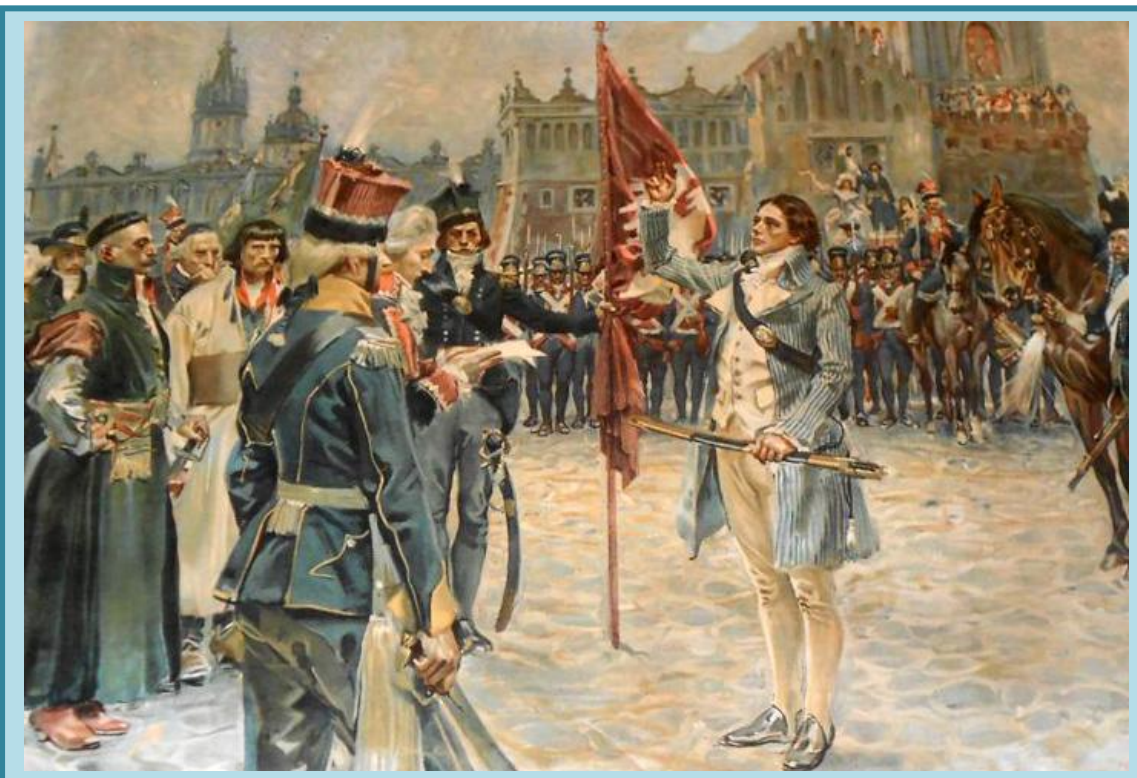
Wojciech Kossak, Przysięga Tadeusza Kościuszki na Rynku w Krakowie

3. Tadeusz Kościuszko stanął na czele powstania – insurekcji kościuszkowskiej skierowanej przeciwko Rosji i Prusom.