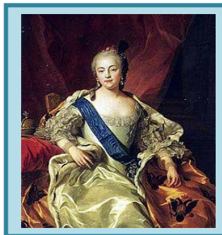
caryca Rosji Katarzynę II