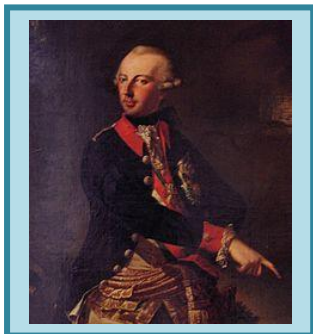
cesarz austriacki Józef II