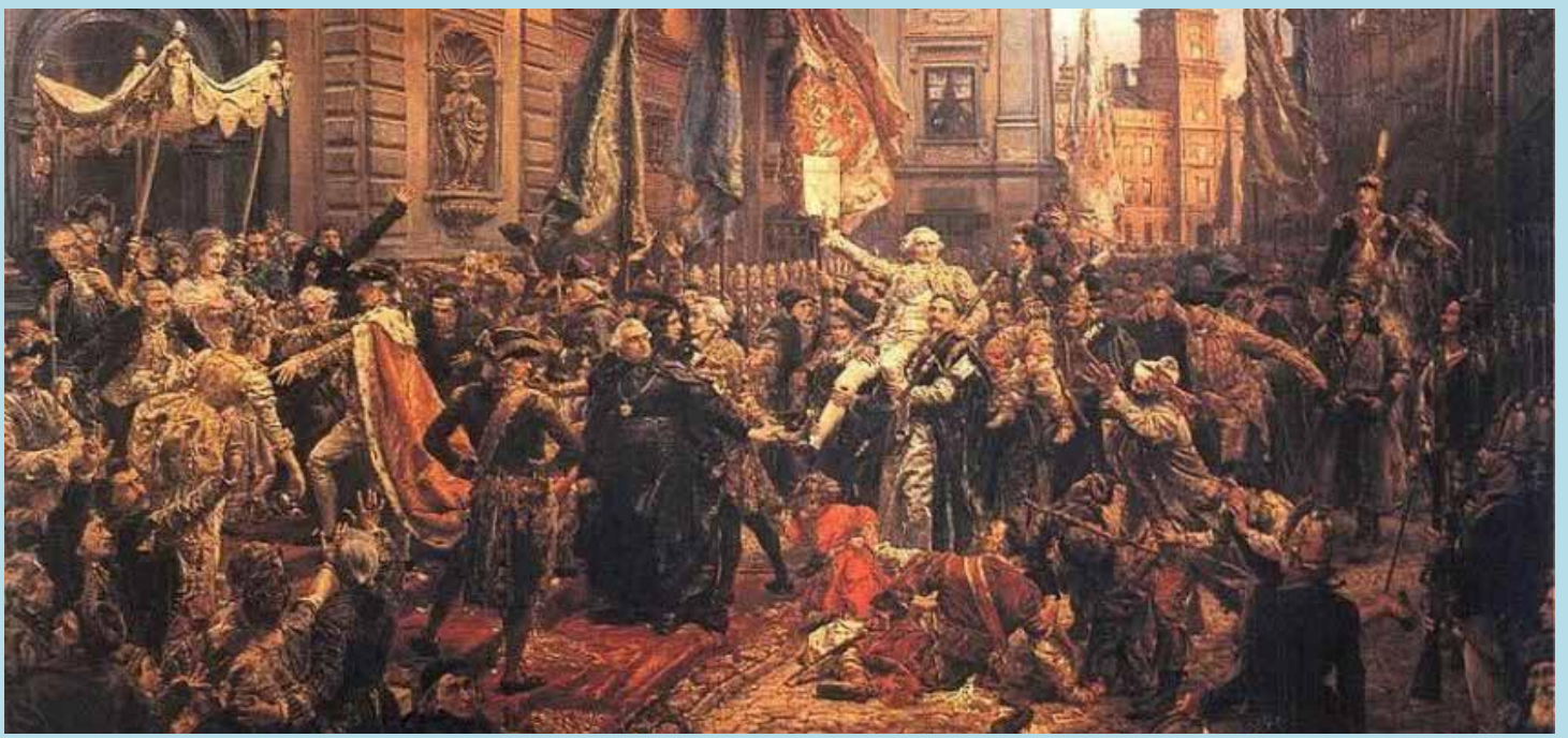
Konstytucja 3 Maja - reprodukcja obrazu Jana Matejki

Do drugiego rozbioru Polski doszło po przegranej przez Polskę wojnie z Rosją w 1792 r. Celem tej wojny była obrona Konstytucji 3 Maja. Król Stanisław A. Poniatowski na żądanie Katarzyny II zaniechał walki i przystąpił w VII 1792 r. do konfederacji targowickiej.